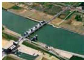
頭首工からの取水