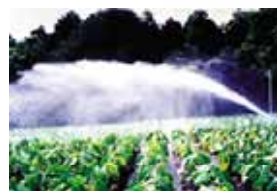
スプリンクラーによるかんがい