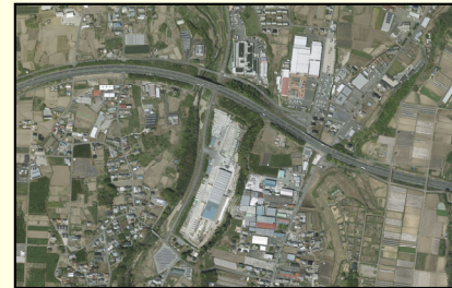
[下井産業団地の状況]