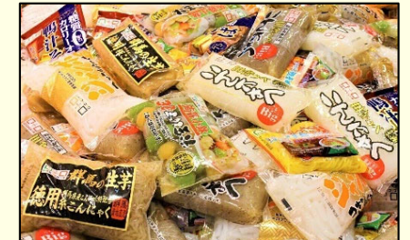
[地元の食材を使った製品]