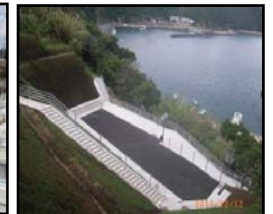
漁村における津波避難対策 (避難地、避難路の整備)