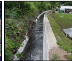
老朽化した用水路の整備・更新と秩序ある土地利用の推進