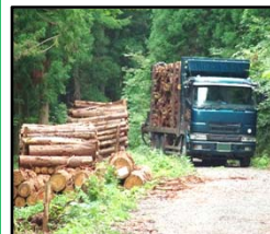
林道等の整備により効率的な間伐材等の搬出を実現