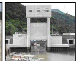
津波・高潮対策としての水門整備