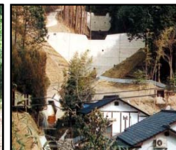
治山施設による山地災害の未然防止