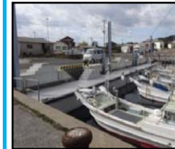
漁業作業の効率化と安全対策のための漁港整備 (岸壁改良)