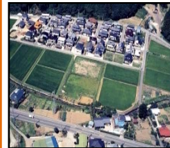
ほ場整備による農業生産性の向上と秩序ある土地利用の推進