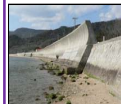
津波、高潮による被害を未然に防ぐため海岸堤防の整備を推進