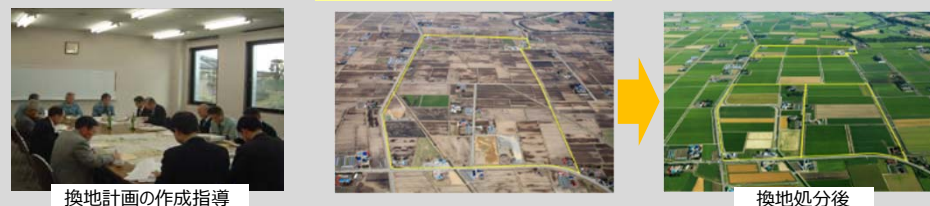
換地計画の作成指導