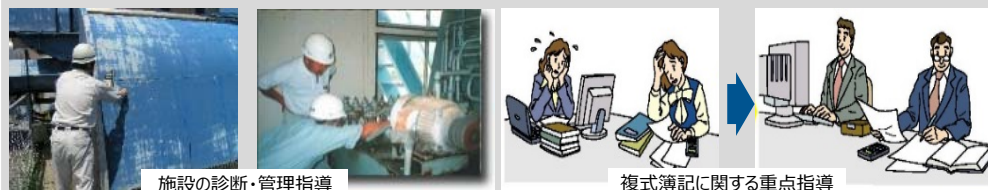
施設の診断・管理指導