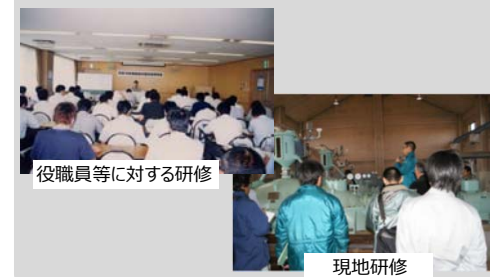
役職員等に対する研修