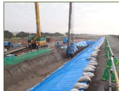
鋼矢板打設による耐震対策