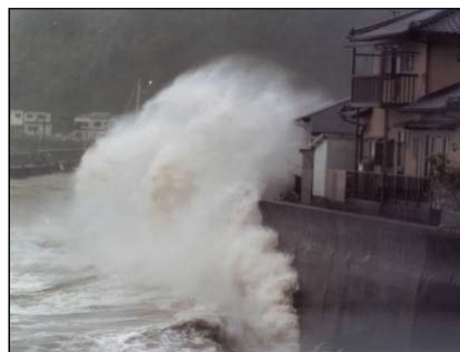
台風時の越波状況