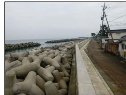
消波ブロックの設置や堤防嵩上げによる越波の防止