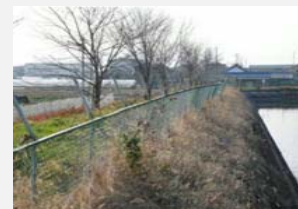
ネットフェンスの更新