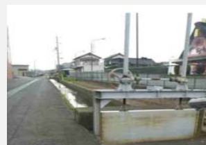
水門開閉の電動化