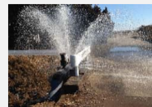
水管橋漏水部の補修