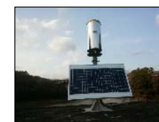
観測機器からの情報