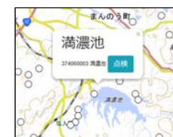
ため池の位置情報