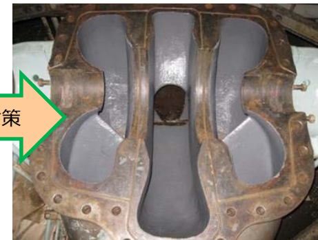
機能保全対策 (劣化したポンプの整備)