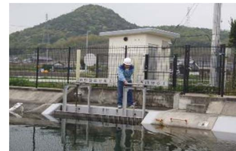
分水工の現地操作