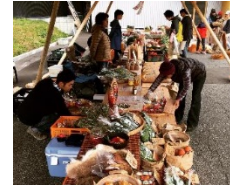
マルシェ等の開催