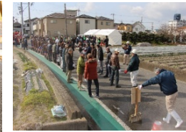
防災訓練や防災兼用井戸の整備