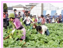
農村ファンの拡大