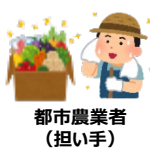
都市農業者 (担い手)