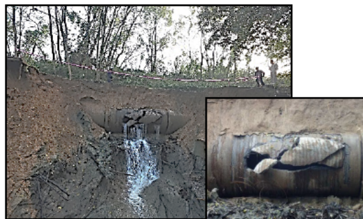
管水路における漏水事故 PC管の劣化