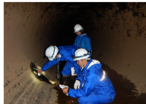
管水路の機能診断