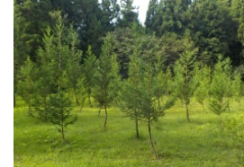
【鳥獣緩衝帯機能を有する植林】