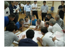
【専門家を入れた話し合い】