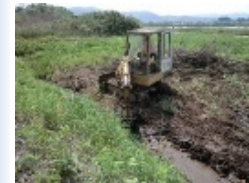
【農地の簡易な整備】