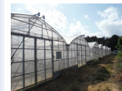
【高収益作物の導入】