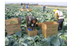
キャベツの生産拡大