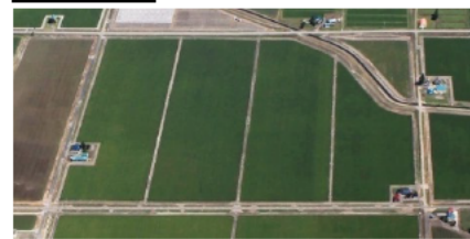
農地の大区画化、耕作放棄地発生の防止