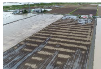
地下かんがいシステムの導入