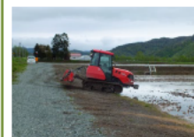
農機の旋回を容易にし、作業効率を向上させるターン農道の整備