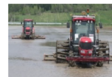
無人運転が可能な自動走行農機の導入