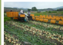
たまねぎの生産拡大