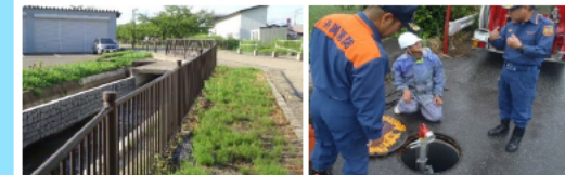
転落防止柵の設置