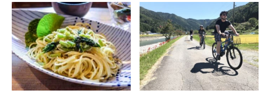
地元食材・景観等を活用した高付加価値コンテンツの開発