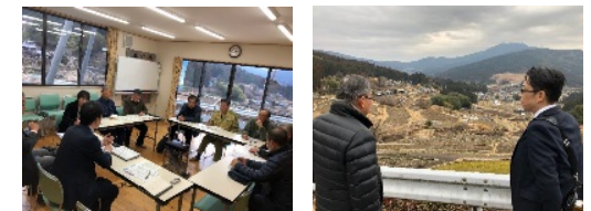
課題に応じた専門家の派遣・指導