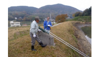
ため池の現地パトロール

【お問い合わせ先】 農村振興局水資源課 (03-3502-6246) 防災課 (03-6744-2210) 設計課 (03-6744-2201) 地域整備課 (03-6744-2209)