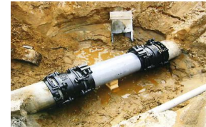
漏水防止のための整備