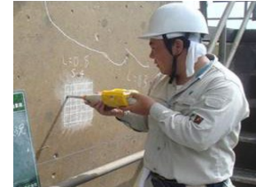
老朽化した施設の機能診断