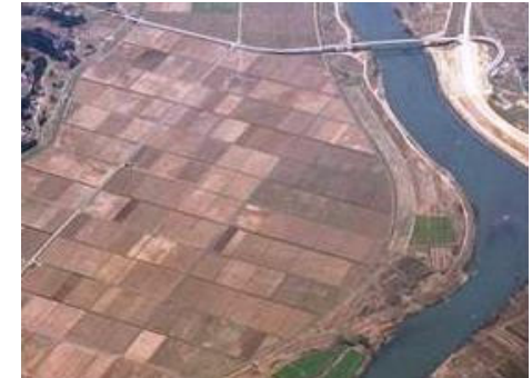
（事業後）大区画化・整形した農地