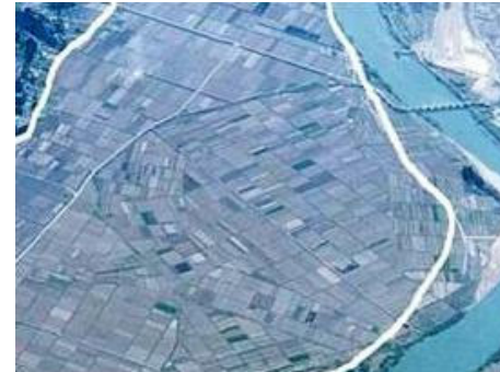
（事業前）小規模で不整形な農地

地域全体の一体的な農地整備によって、労働・土地生産性が向上し、併せて担い手への農地集積や高収益作物の導入を図ることで、競争力ある農業の実現に寄与します。