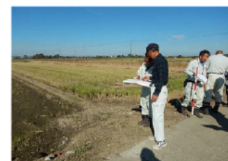
〔土地境界を確認するための立会〕