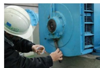
〔ポンプ設備を分解することなく、潤滑油採取による診断技術を確立〕