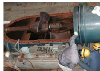
〔ポンプ施設の劣化状況調査〕