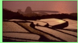
中山間地域 (山口県長門市)

中山間地域等において、農業生産条件の不利を補正することにより、将来に向けて農業生産活動を維持するための活動を支援