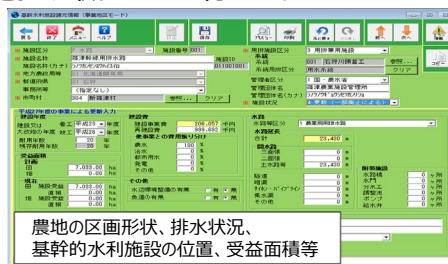
農業農村整備事業の実績を調査