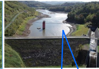
貯水位が低い状況