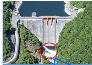
放流設備からの放流状況