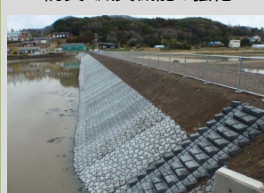
ため池護岸の整備