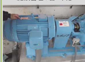
高効率型モータへの更新