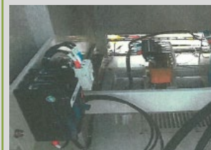
進相コンデンサの設置