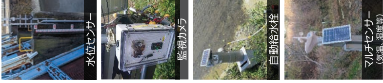
水位センサー 監視カメラ 自動給水栓 マルチセンサー （気温、湿度等）