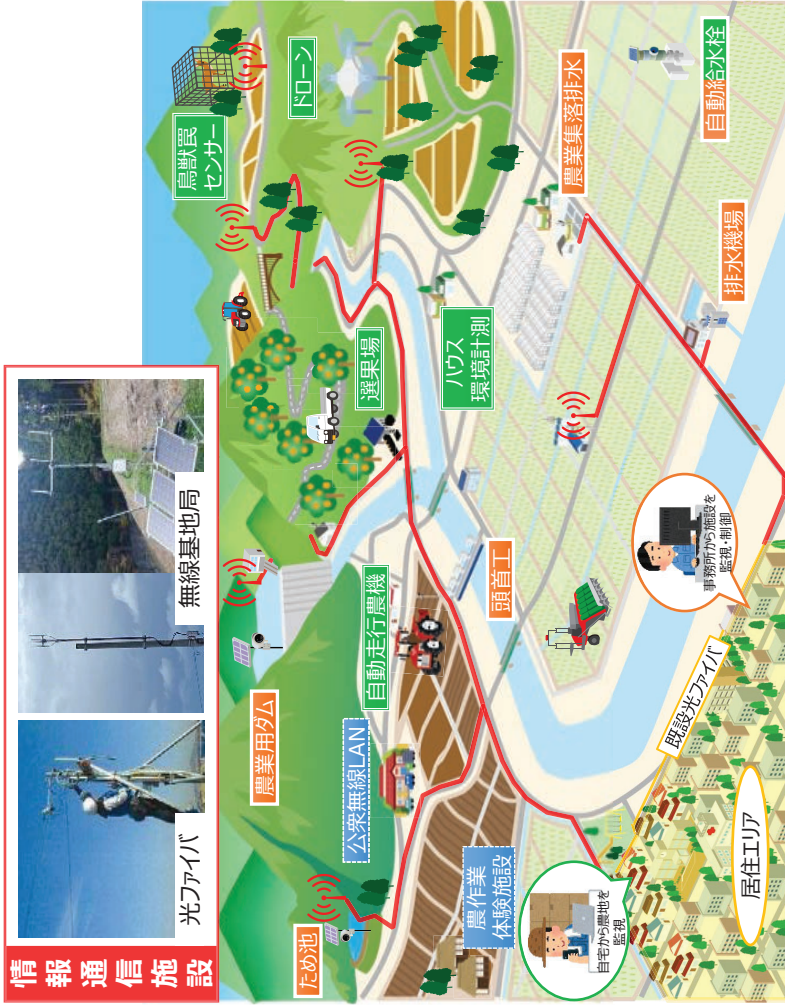
（情報通信施設の活用例）