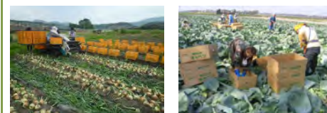
たまねぎの生産拡大