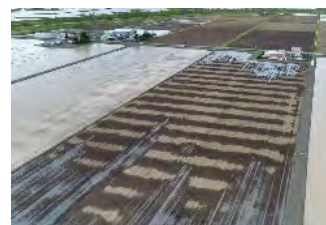
地下かんがいシステムの導入