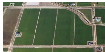
農地の大区画化、耕作放棄地発生の防止