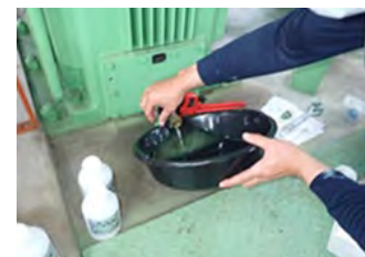
〔 ポンプ設備を分解することなく、潤滑油採取による診断技術を確立 〕