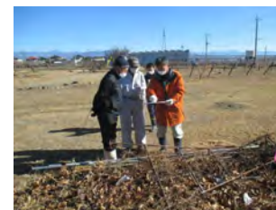
〔 土地境界を確認するための立会 〕