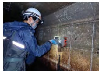
〔 水路の鉄筋探査状況 〕