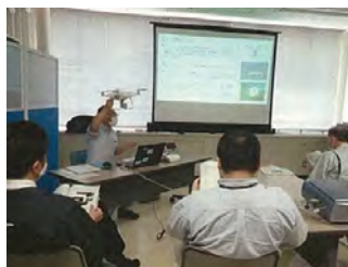
〔 UAV技術習得の研修 〕