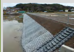
ため池護岸の整備