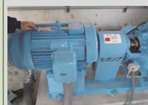
高効率型モータへの更新