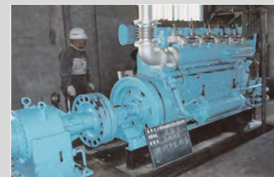
原動機の分解補修、塗装