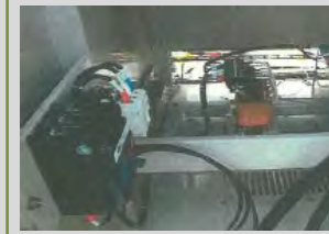
進相コンデンサの設置