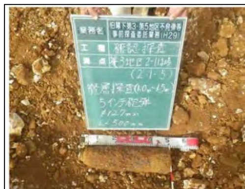
不発弾 (5 cm砲弾)