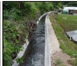
老朽化した用水路の整備・更新