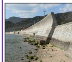
津波、高潮による被害を未然に防ぐため海岸堤防の整備を推進