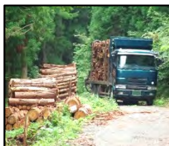
林道等の整備により効率的な間伐材等の搬出を実現