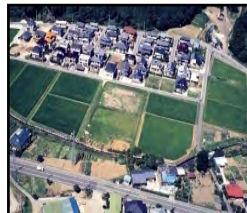
ほ場整備による農業生産性の向上と秩序ある土地利用の推進