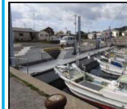
漁業作業の効率化と安全対策のための漁港整備（岸壁改良）