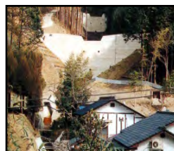
治山施設による山地災害の未然防止