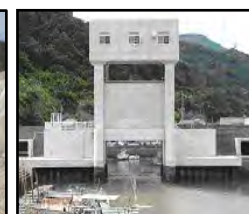
津波・高潮対策としての水門整備

（共通）切迫する南海トラフ地震、日本海溝・千島海溝周辺海溝型地震等の発生を見据えた防災インフラ整備