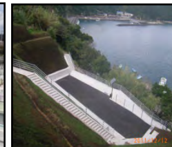
漁村における津波避難対策（避難施設、避難経路の整備）