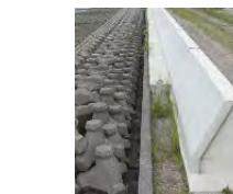
堤防高上工(計画高までの整備)