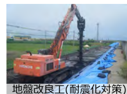
地盤改良工(耐震化対策)