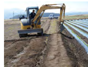
畦畔の再構築を支援