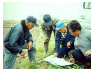
水利用・土地利用等の 調査・調整活動を支援