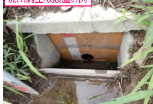
流出調整板設置の例