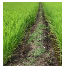
畦畔が痩せ 容易に雨水が流出