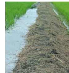
堅牢な畦畔により 雨水を安全に貯留