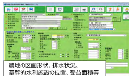
農地の区画形状、排水状況、基幹的水利施設の位置、受益面積等 農業農村整備事業の実績を調査

農業農村整備事業等に係る事業実績及び農地、基幹的農業水利施設の整備状況の把握、取りまとめを行います。