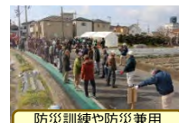
防災訓練や防災兼用井戸の整備

都市農地貸借法に基づく農地の貸借による次世代の担い手づくり等の取組に対し、加点により優先。