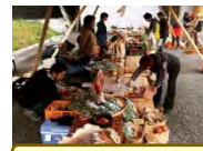
マルシェ等の開催