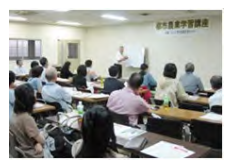
税・相続に関する講習会