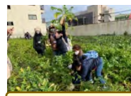
農作業体験会の開催