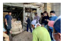
環境負荷低減への取組