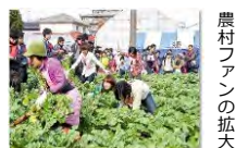
農村ファンの拡大