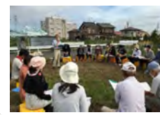
都市農業アドバイザーの派遣