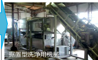
据置型洗淨用機械

・乗用型洗淨用機械施設により、農作物に付着した火山灰を洗淨し、収量及び商品性の低下を防止します。