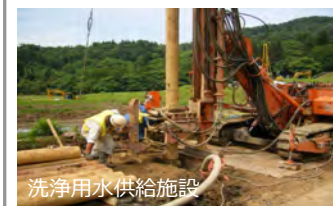
洗淨用水供給施設

・農作物の洗淨のための用水を供給する施設により、洗淨効果を高め、収量及び商品性の低下を防止します。