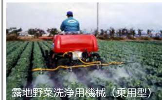
露地野菜洗淨用機械（乗用型）