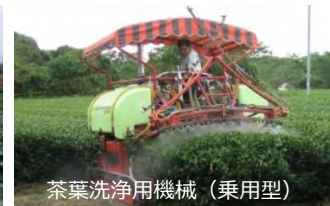
茶葉洗淨用機械（乗用型）

・乗用型洗淨用機械施設により、農作物に付着した火山灰を洗淨し、収量及び商品性の低下を防止します。