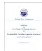
魚道整備ガイドライン

前歴事業で策定された魚道整備ガイドラインを活用し、新たな魚道整備のための優先箇所調査を行います。また、同ガイドラインの理解醸成のためのワークショップを行い、それを通じた人材育成を行います。