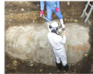
試掘による管外面調査