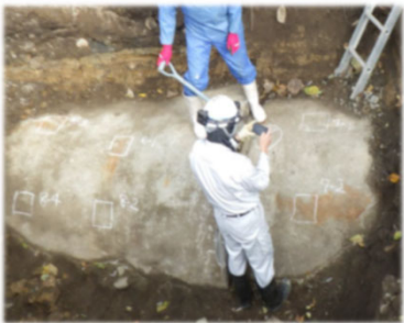
パイプラインの試掘調査