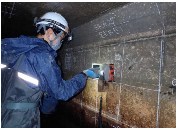
水路の鉄筋探査状況