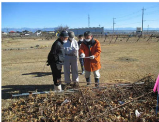
土地境界を確認するための立会