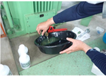
ポンプ設備を分解することなく、潤滑油採取による診断技術を確立