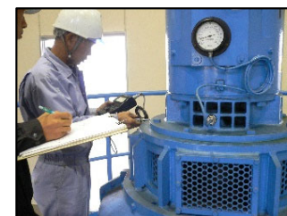
（ポンプの点検整備）