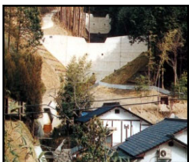
治山施設による山地災害の未然防止