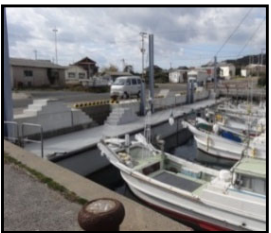
漁業作業の効率化と安全対策のための漁港整備（岸壁改良）