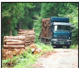
林道等の整備により効率的な間伐材等の搬出を実現