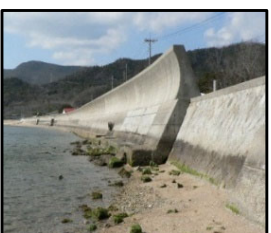
津波、高潮による被害を未然に防ぐため海岸堤防の整備を推進