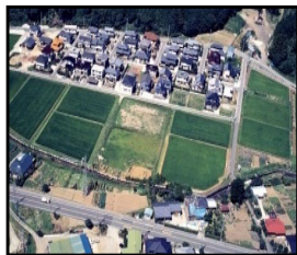
ほ場整備による農業生産性の向上と秩序ある土地利用の推進