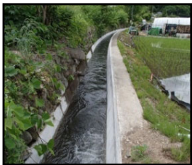
老朽化した用水路の整備・更新