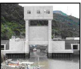
津波・高潮対策としての水門整備

（共通）切迫する南海トラフ地震、日本海溝・千島海溝周辺海溝型地震等の発生を見据えた防災インフラ整備