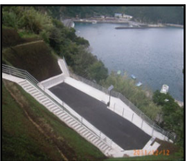
漁村における津波避難対策（避難施設、避難経路の整備）