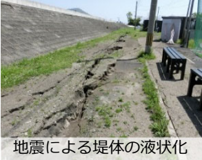
地震による堤体の液状化