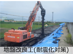
地盤改良工（耐震化対策）