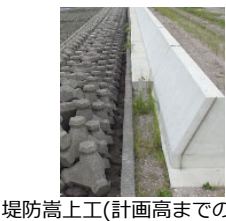
堤防嵩上工（計画高までの整備）