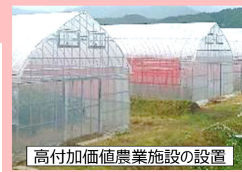
高付加価値農業施設の設置

※ 4 高収益作物転換プラン作成支援、技術習得方法の検討と実践、技術者育成、試験販売等の経営展開支援、現場での研修会等について、単年度あたり300～500万円迄を支援 ※ 5 実証展示場の設置・運営、導入1年目の種子・肥料等への支援、農業機械のリース、高付加価値農業施設の設置 等