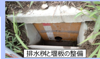
排水柵と堰板の整備

※ 6 ソフト事業はハード実施区域に限らず、流域治水対策実施区域内での実施が可能