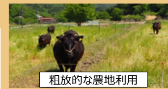
粗放的な農地利用