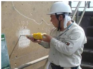
老朽化した施設の機能診断