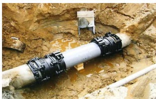
漏水防止のための整備