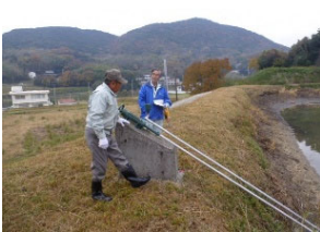
ため池の現地パトロール