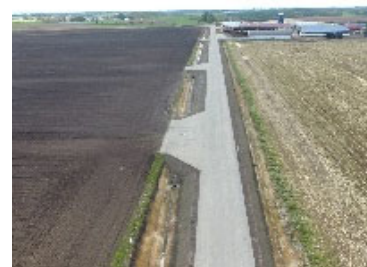
農道整備による輸送効率の向上