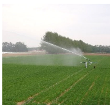
畑地かんがい施設の整備