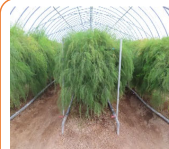
野菜・果樹への転換