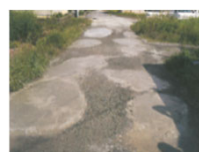
農道の窪みの補修