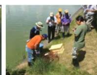
ため池の外來種駆除

実施主体：農業者等で構成される組織（①及び③は農業者のみで構成する組織でも取組可能） 対象農用地：農振農用地及び多面的機能の発揮の観点から都道府県知事が定める農用地