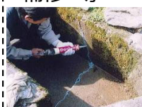
水路のひび割れ補修