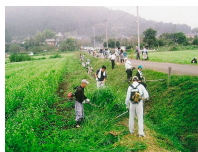
農地法面の草刈り