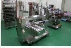
農林水産物処理加工施設の整備