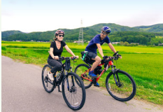
地元食材・景観等を活用した観光コンテンツの造成