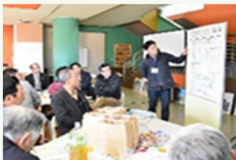
地域活性化のための活動計画づくり※