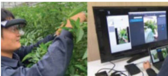
栽培技術のeラーニング

地域における土地利用構想の作成から実現までの取組や荒廃農地の再生を総合的に支援します。