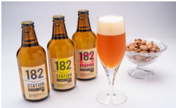
地域資源を活用した商品開発