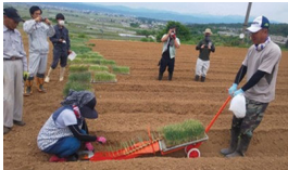
高収益作物の導入