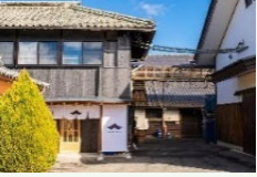
遊休資産を活用した滞在施設の整備