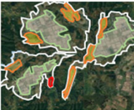
土地利用構想の作成

地域における土地利用構想の作成から実現までの取組や荒廃農地の再生を総合的に支援します。