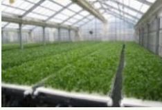
障害者等が作業に携わる生産施設の整備