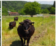
農地の粗放的利用