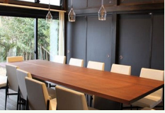
食の高付加価値化に不可欠な内装の改修