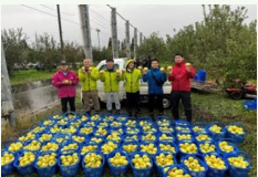
官民共創による地域課題解決