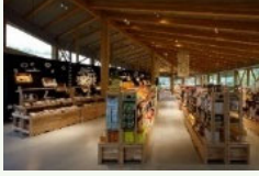
農林水産物販売施設の整備