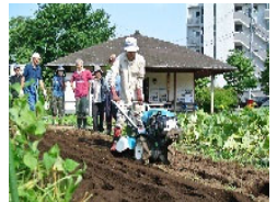
都市農地貸借による担い手づくりへの支援