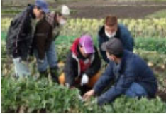
障害者等の農林水産業に関する技術の習得