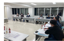
合意形成・計画づくり

住民意向調査、地域住民によるワークショップ開催 資源活用の推進体制・組織の整備、実施計画づくり 等