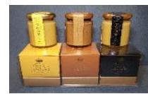
地域産品の加工・商品化

地域資源（農林水産物等）を使った地域産品づくり※ 観光体験プログラム開発、モニターツアー実施 既存の直売所等と連携した販売促進、地域ブランドづくり 商品パッケージ等のデザイン検討、ECサイトの立ち上げ 等 ※商品の製造加工を非振興山村地域で行うことも可能