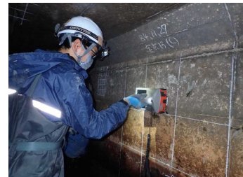
[ 水路の鉄筋探査状況 ]