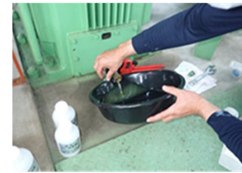
[ ポンプ設備を分解することなく、潤滑油採取による診断技術を確立 ]