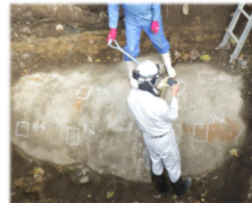
[ パイプラインの試掘調査 ]