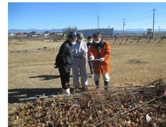
[ 土地境界を確認するための立会 ]