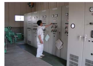
ポンプ施設の運転