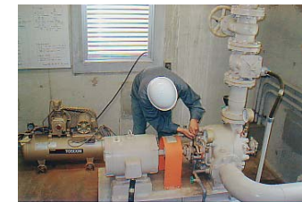
施設の点検・整備