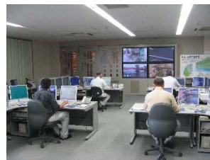
中央管理所での操作