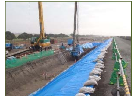
鋼矢板打設による耐震対策