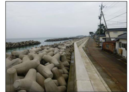
消波ブロックの設置や堤防高上げによる越波の防止