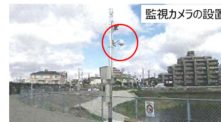
監視カメラの設置