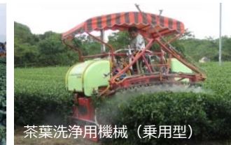
茶葉洗浄用機械 (乗用型)

・乗用型洗浄用機械施設により、農作物に付着した火山灰を洗浄し、収量及び商品性の低下を防止します。