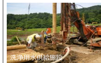
洗浄用水供給施設

・農作物の洗浄のための用水を供給する施設により、洗浄効果を高め、収量及び商品性の低下を防止します。