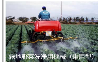
露地野菜洗浄用機械 (乗用型)