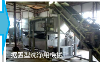
据置型洗浄用機械

・乗用型洗浄用機械施設により、農作物に付着した火山灰を洗浄し、収量及び商品性の低下を防止します。