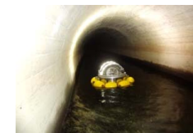
通水状態でトンネル内のひび割れ、漏水箇所を調査