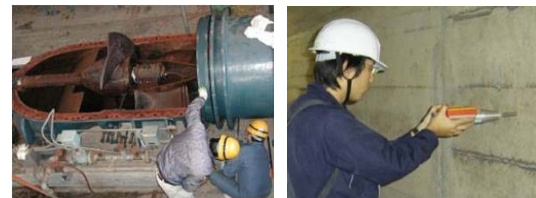
ポンプ施設の劣化状況調査 リバウンドハンマー試験