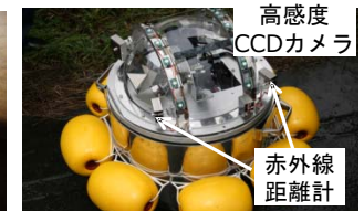
点検ロボット（無人調査）