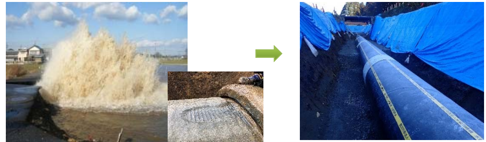
管水路における漏水事故 PC管の劣化