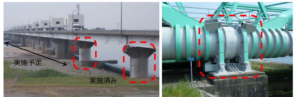
頭首工の耐震対策（コンクリートの巻立）